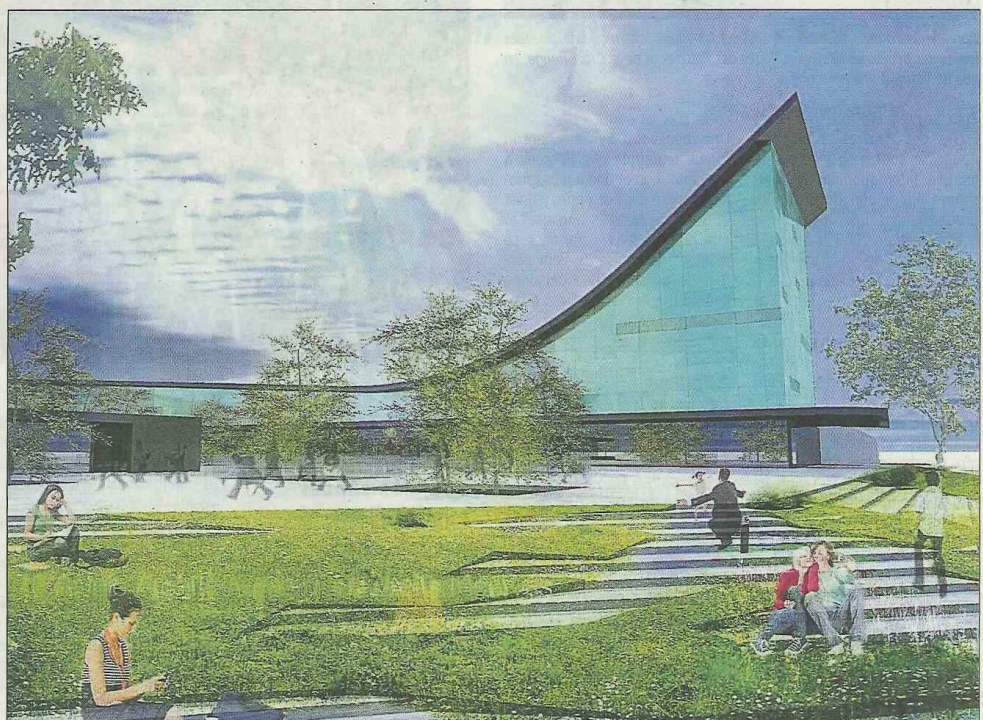
Les Quais de Séné, futures locomotives commerciales de l'est-vannetais (Cabinet Axiale architecture).